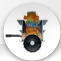
SELF CLEANING PATENTED BRAZIER